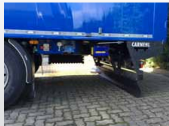
Centralny panel sterowania