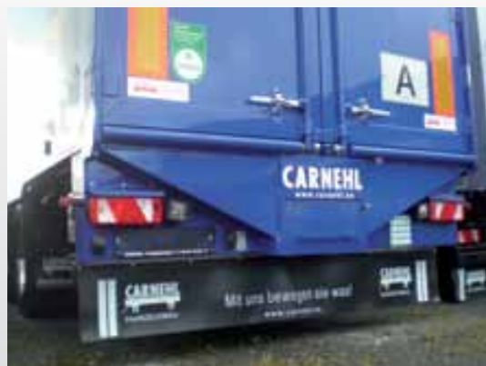
Wąż wylotowy z wspornikiem