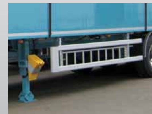
Boczne, uchylnie zabezpieczenia przeciw wjazdowe z drabiną