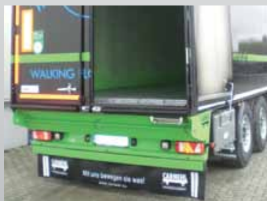
Tyłny wzdłużny fartuch z logo firmy