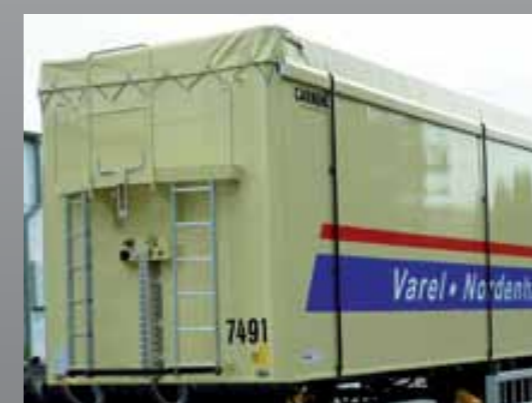
Obustronny podest operacyjny (balkon)