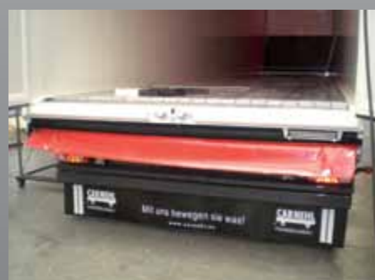
Plandeka ochronna podłogi