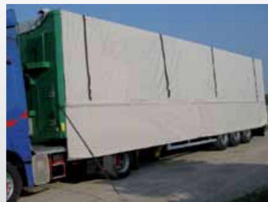
Boczna plandeka ochronna