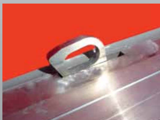
Szczelnie zamknięty pierścień mocujący