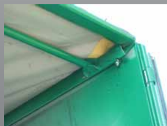
Mocowanie tylnego skrzydła