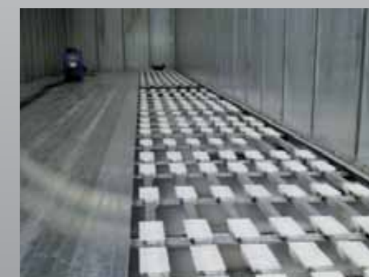
Podłoga z ciągłym połączeniem bocznym