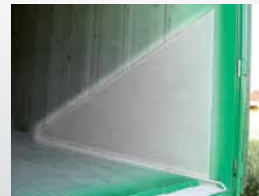
Panel wzmacniający ścianę boczną